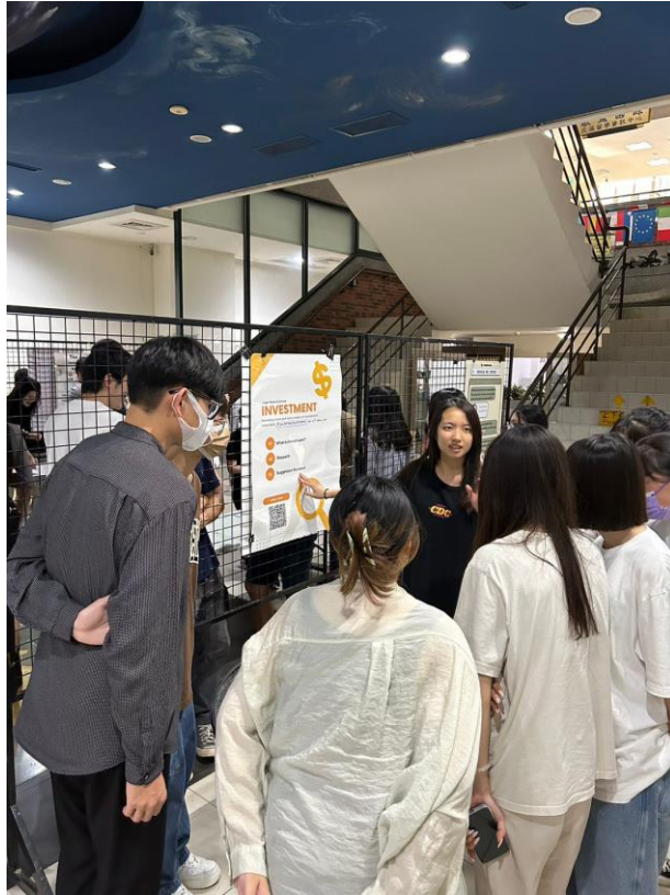
7. 同學聚精會神聽簡報