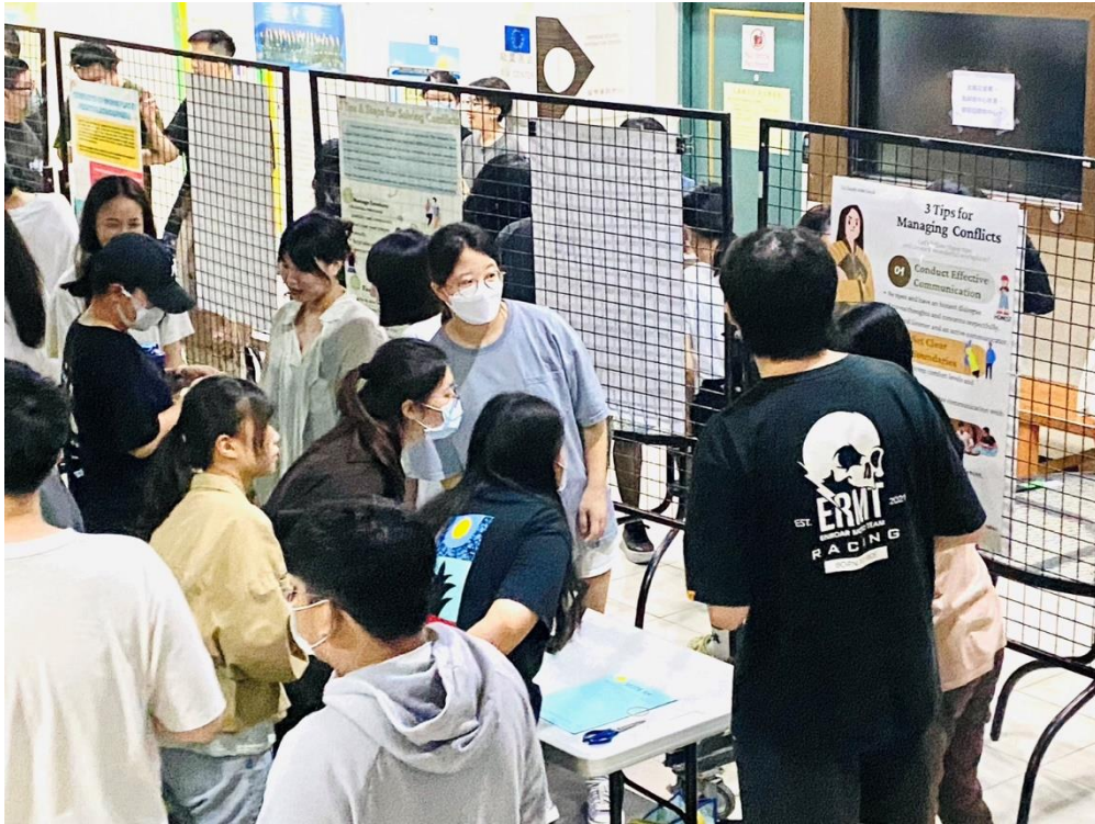
3. 同學認真端詳並票選出優良作品