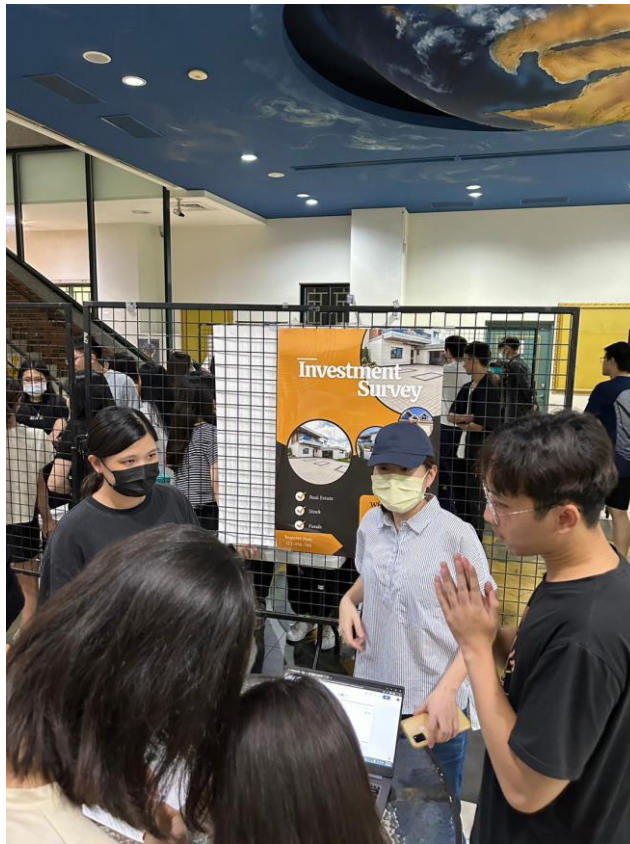
8. 各組簡報主題非常多元