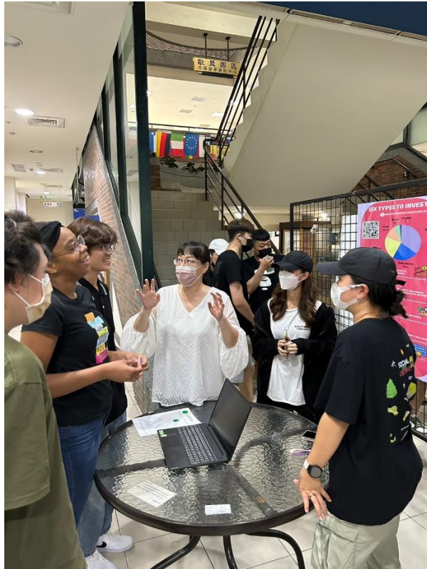
5. 藉展示作品與觀眾溝通理念