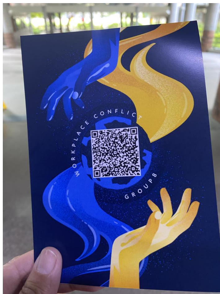
12. 同學製作精美的卡片宣傳