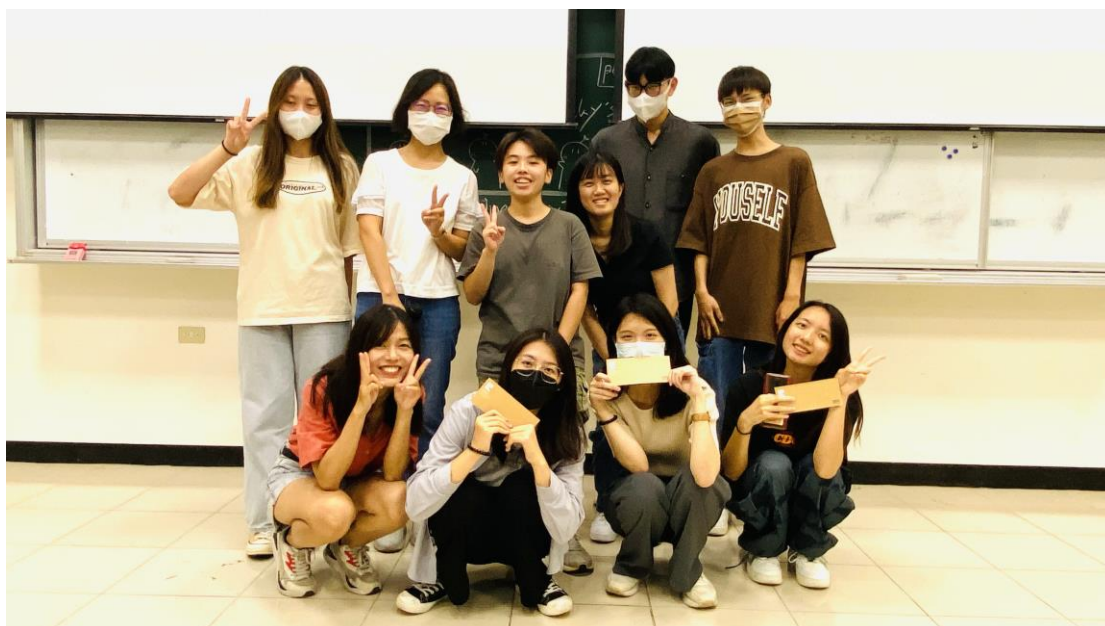
11. 各班票選出 3 組優勝同學-蔡佳蓉老師指導