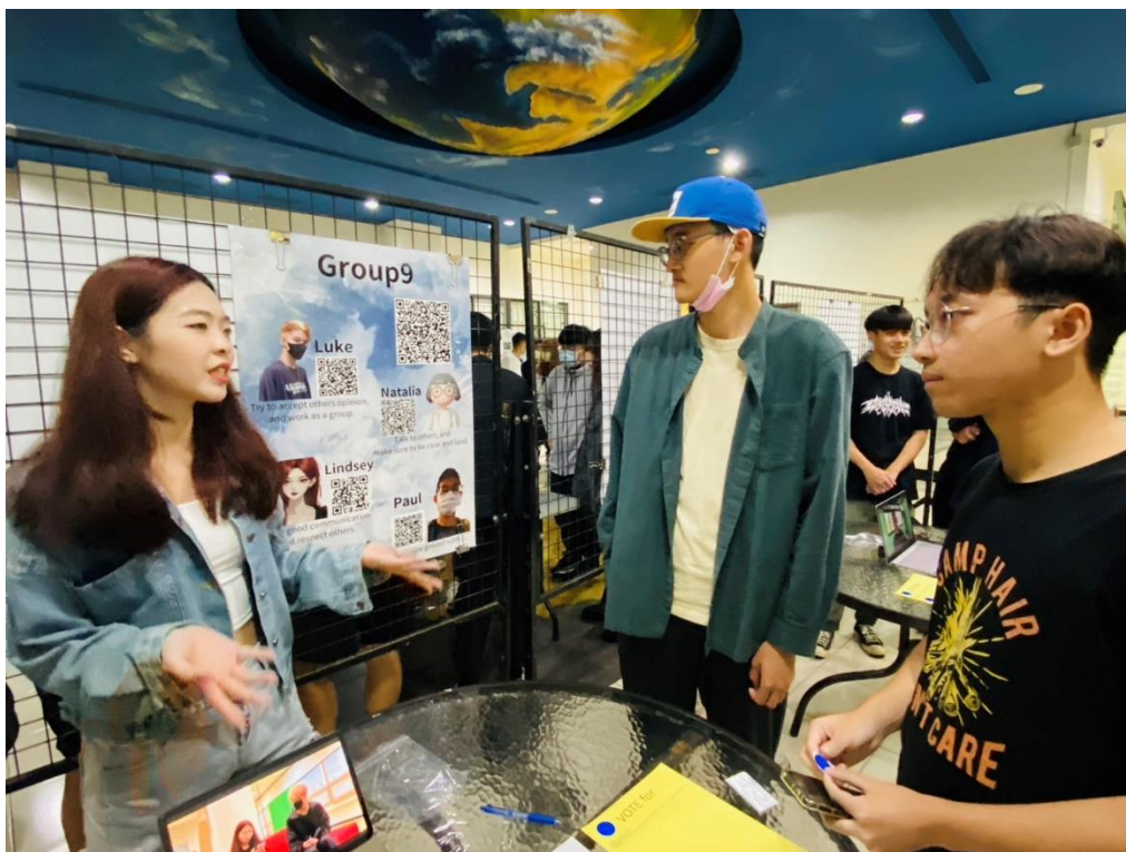
4. 各組成員熱心為觀眾講解作品理念、探討之問題及解決方案