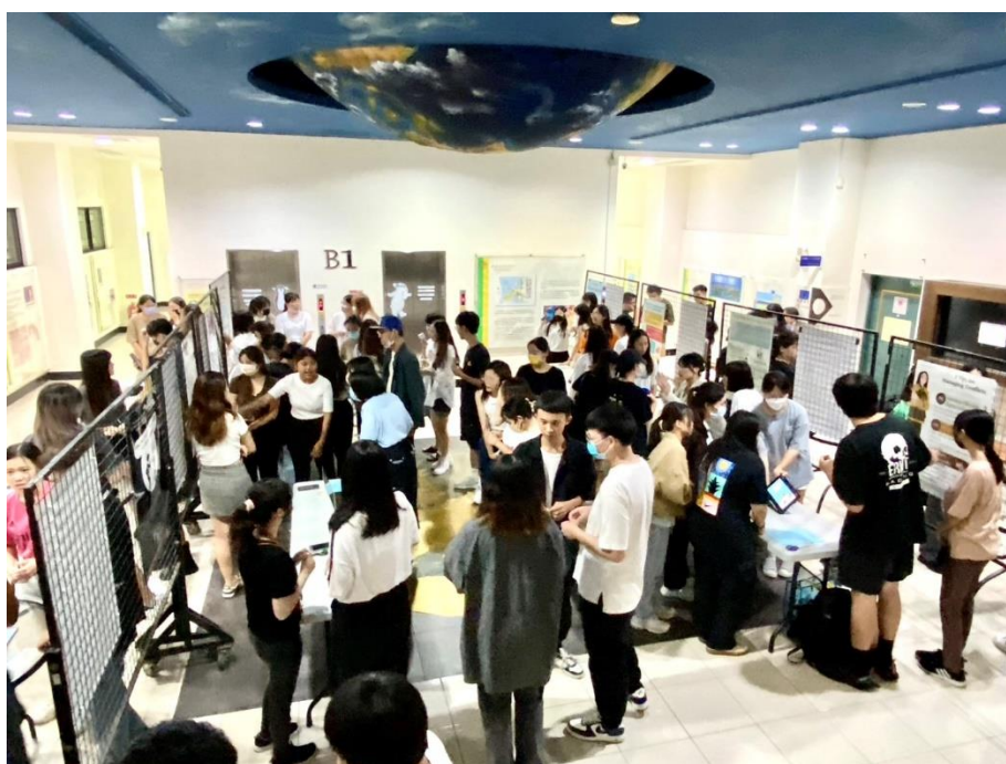
2. 成果展示現場-歐盟園區